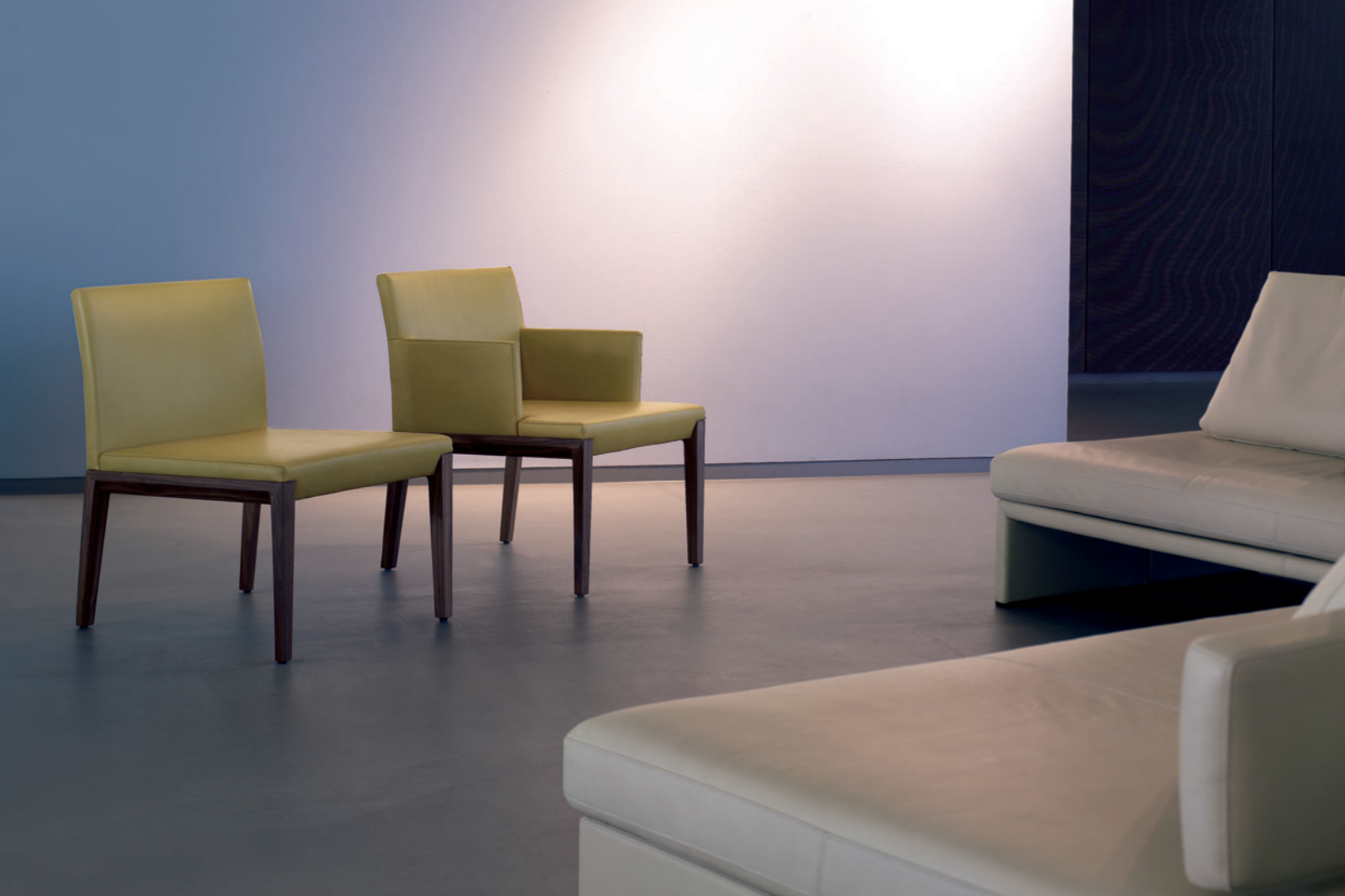
Andoo 1100. Design: EOOS.